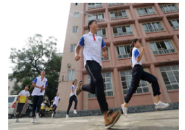
高清:融安举行防空警报试鸣和紧急疏散演练