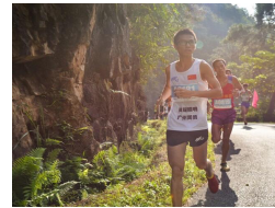
庆祝自治区成立60周年 “奔跑吧广西”桂平站收