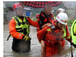
积水围村1米深 河池消防紧急转移2名被困老人(图)