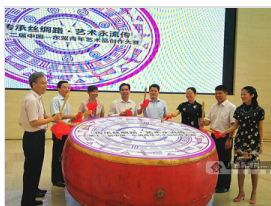
第12届中国-东盟青年艺术作品创作赛获奖作品开展