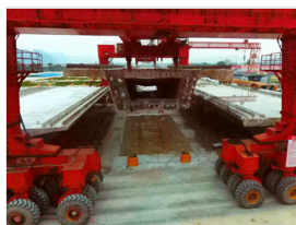
贵南高铁现场：巨型轮式“龙门吊”轻松吊运“巨无霸”