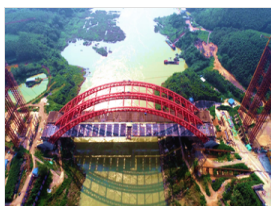
高清图集：发现新广西