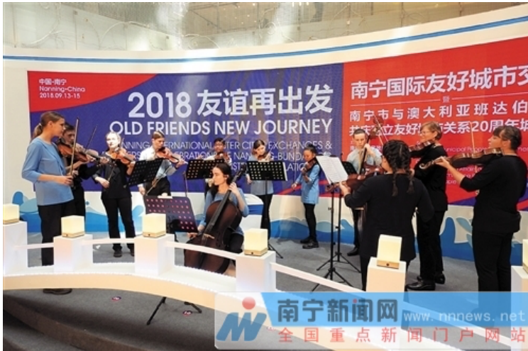
澳大利亚班达伯格市的弦乐团现场表演交响乐

国际友城是一个城市拓展对外交往空间和扩大对外交流与合作的重要平台。如今,南宁的“朋友圈”已遍及亚洲、非洲、欧洲、北美洲及大洋洲,多年来,南宁与朋友们在经济、文化、教育、旅游、商贸等领域的交往日益频繁。9月13日,在“2018友谊再出发”——南宁国际友好城市交流暨南宁市与澳大利亚班达伯格市共庆建立友好城市关系20周年城市展上,四位来自南宁“朋友圈”的国际友人畅谈对南宁的城市印象,期盼透过更广泛的交流与合作让友谊历久弥新。