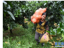
广西武宣:柚子收获助增收