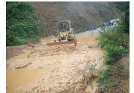
凤山境内一道路塌方致交通中断 公路部门抢通(图)