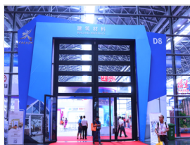
智能科技助力生活 记者带你探营建筑材料馆(组图)

广西日报社概况 | 报社领导活动 | 广西日报传媒集团版权声明 | 关于广西新闻网 | 招聘英才 | 广告服务 | 网站声明 | 呼叫中心