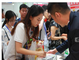
马来西亚馆：猫山王榴莲冰激凌受到市民疯狂抢购