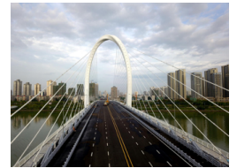
9月19日焦点图:中秋将到 细数柳州“最美赏月地”